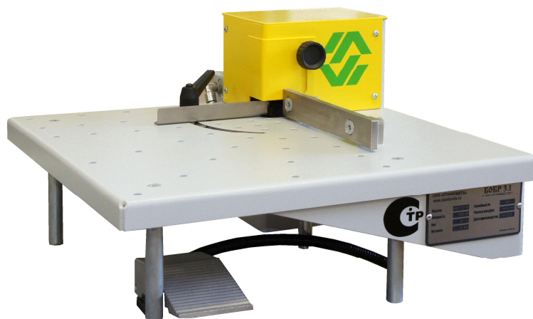
ТОРЦОВКА ПОД РАЗНЫМИ УГЛАМИ